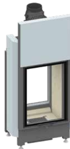
Lina TV 5580 mit ½ hochschiebbarer Frontseite und schwenkbarer Rückseite